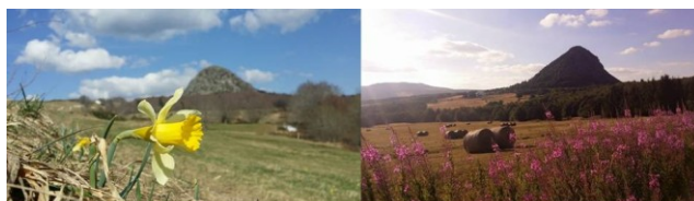
Les 4 saisons du Mont Gerbier de Jonc

La réussite de nos activités et la vie de notre club est soumise à votre participation.